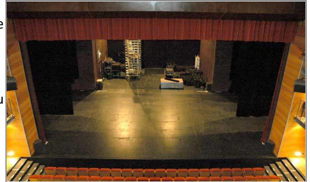
Vue de la régie