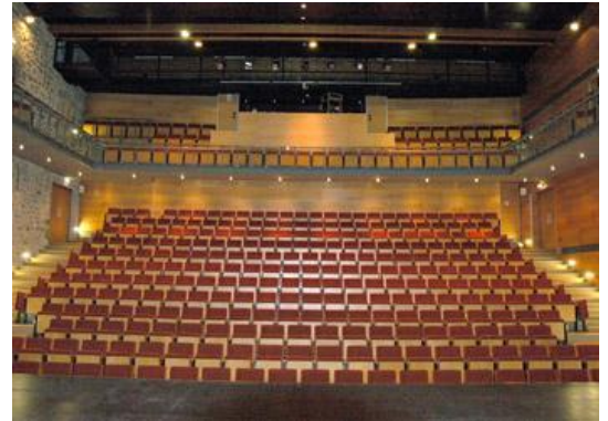
Vue du plateau

Cette partie du plateau fait également office de lieu de stockage pour le matériel scénique.